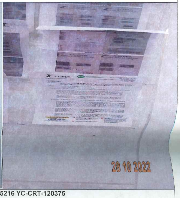
EDICTOS DE LA R_35216 YC-CRT-120375